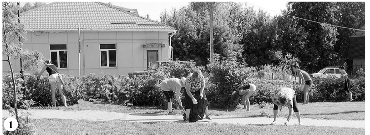
Фото: 1. Работы в сквере интернационалистов (п. Бабынино). 2. Разноцветные шины будут использованы на детской площадке (п. Бабынино). 3. Субботник в п. Воротыньск. 4. В с. Утешево.